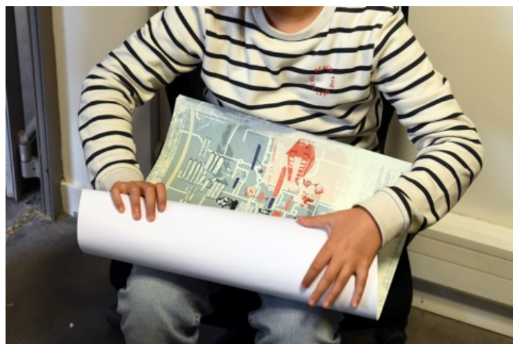
« Moi je vais l'accrocher dans ma chambre ! », affirme un enfant au sujet de la carte Villejean P(a)lace, le 15 novembre 2023.

En travaillant avec des acteur-rices qui ne sont pas du monde académique, notre volonté était aussi de réfléchir à nos postures de recherche, et à les adapter pour qu'il ne s'agisse pas seulement de documenter des situations, mais aussi que chacun-e puisse agir et les transformer quand elles sont jugées insatisfaisantes.