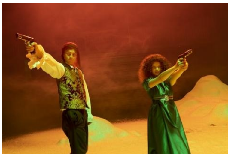
Daddy , mise en scène de Marion Siéfert, texte de Marion Siéfert et Mathieu Baryre, du 22 au 25 novembre au TNB, salle Serreau, dans le cadre du festival du TNB.

Cette rencontre est organisée en partenariat avec le TNB, dans le cadre du Festival du TNB ( https://www.t-n-b.fr/programmation/festival-tnb-2022 ).