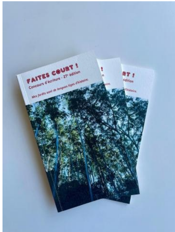
Recueil concours d'écriture "Faites court !" 2026.

Y a-t-il un livre / texte coup de cœur ou une lecture récente que vous aimeriez nous recommander ?