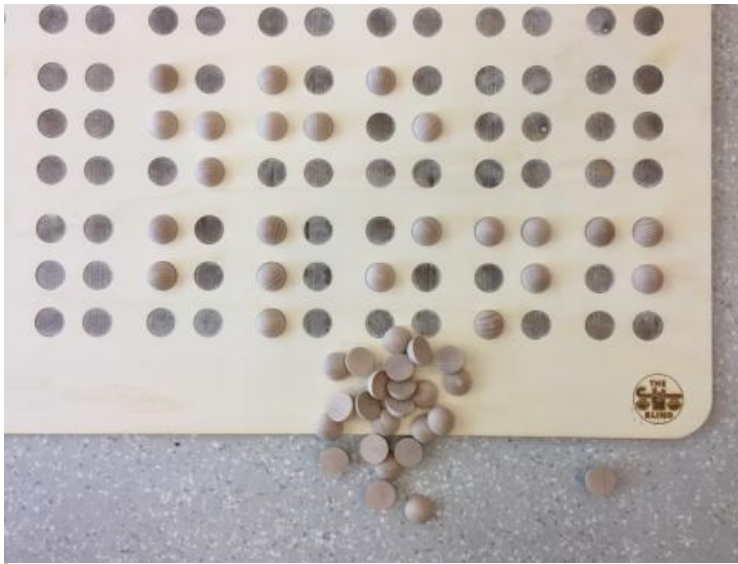
Jeu braille - Jeu en cours de création avec l'Edulab de Rennes 2