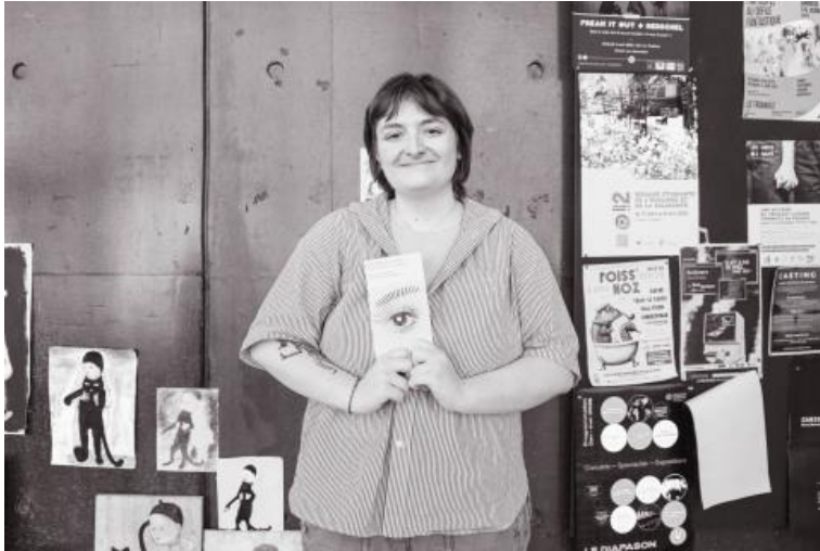
Remise de prix du concours "Faites court !" 2025