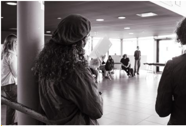
Remise de prix du concours "Faites court !" 2025