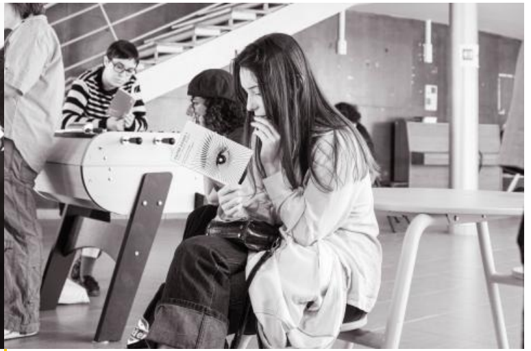
Remise de prix du concours "Faites court !" 2025