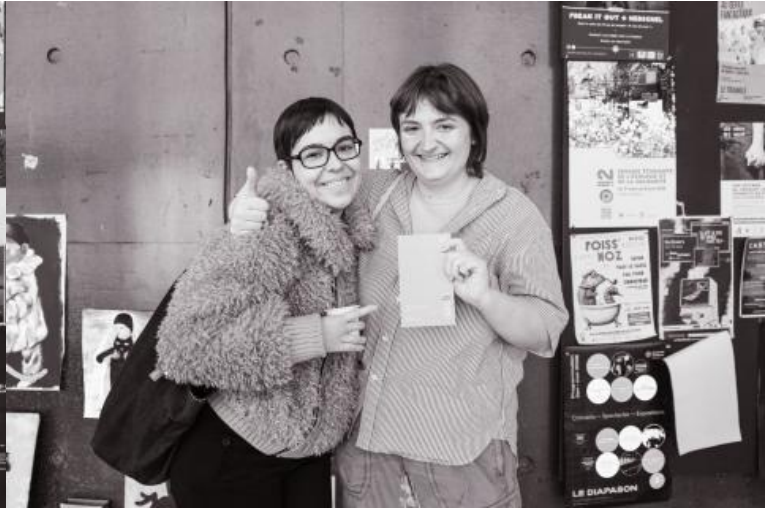
Remise de prix du concours "Faites court !" 2025